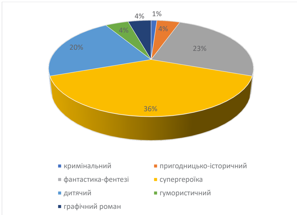
Діаграма 1. Відсоткова кількість пожанрового видання коміксів 2018 р.